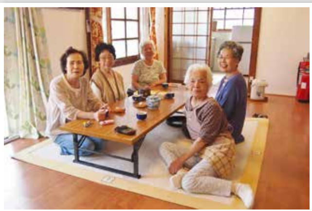
お茶とお菓子でいきいきサロン

10月末まで受け付けていますので、希望される方は、まち協ふれあいサロンにファックスまたは電話、持ち込みなどで申し込んでください。自治会長、民生協力委員に渡していただくこともできます。お待ちしています。費用は、無料です。