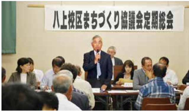
平成28年度八上校区まちづくり協議会定期総会 平成28年5月14日

まち協の活動が充実しますよう、皆様のご支援・ご協力をよろしく願います。また、総会資料はまち協ふれあいサロンにありますので、ご覧になりたい方はお越し下さい。